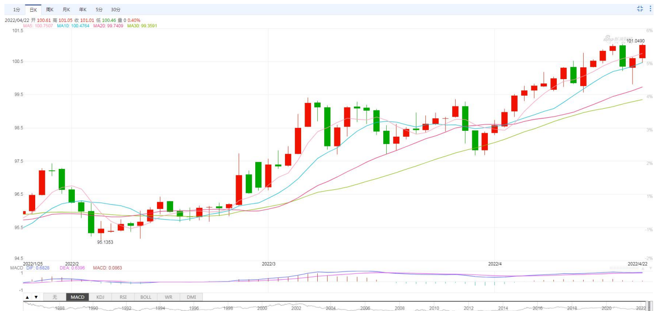
图 1. 美元指数日 K 线

俄乌冲突以来，受地缘局势不安、美联储加息、美国经济相对欧洲等国家表现较好的提振，美元指数一直在震荡走高。美元指数在近期的 15 个交易日中，有 13 个交易日攀升至 2020 年 5 月以来的最高水平。这使得美元指数回到了 2020 年 3 月疫情爆发之初恐慌期间的水平，当时全球投资者纷纷涌入美元避险。