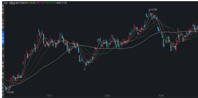
图 2.国债期货 10 年期日 K 线图

集体收涨，10年期主力合约涨0.18%，5年期主力合约涨0.13%，2年期主力合约涨0.04%；周周四国债期货小幅收涨，国债期货10年期主力合约盘中上涨0.04%，5年期上涨0.07%，2年期上涨0.04%；周五国债期货收盘涨跌不一，10年期主力合约跌0.08%，5年期主力合约接近收平，2年期主力合约涨0.02%。