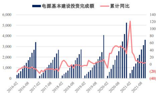
图3. 电源基本建设投资

电力： 2022年1-2月电源累计投资471亿元，同比下滑1.9%，电网累计投资313亿元，同比增长37.6%。电网投资超前发力，稳增长调控预期明显。