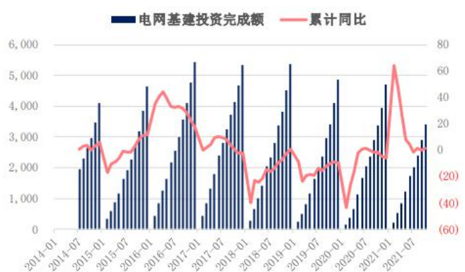
图4. 电网基本建设投资