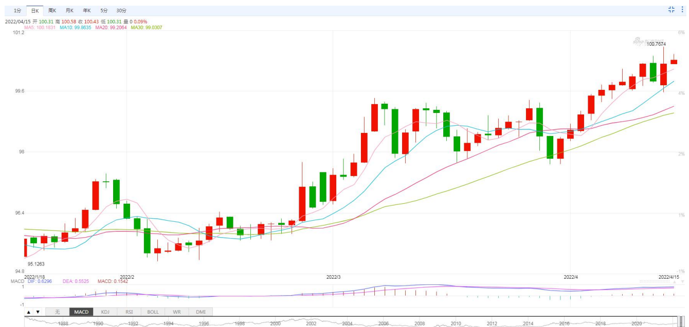
图 1. 美元指数日 K 线

受美国经济数据表现及美联储官员讲话影响，令投资者预期美联储将采取更为激进的货币政策，在西方耶稣受难日和复活节小长假来临之际，美股及美债隔夜市场受到抛售，美元指数表现强势，站稳 100 关口上方。