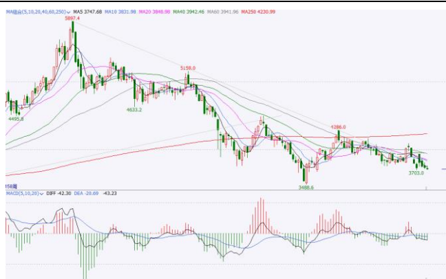
图 5.IF 加权周 K 线图

周线方面，IF 加权连续三周下跌，逼近前期低点 3700 关口，均线簇空头排列、向下发散，若被有效跌破需防范调整加深风险。