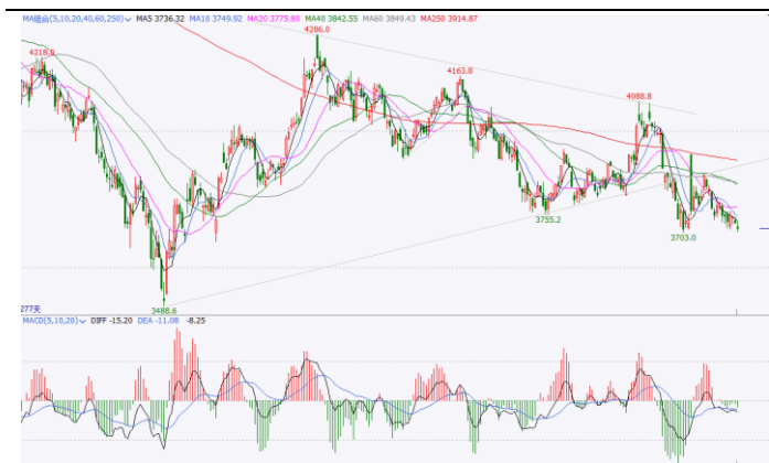
图 5.IF 加权日 K 线图