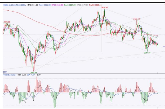
图 6.上证指数日 K 线图