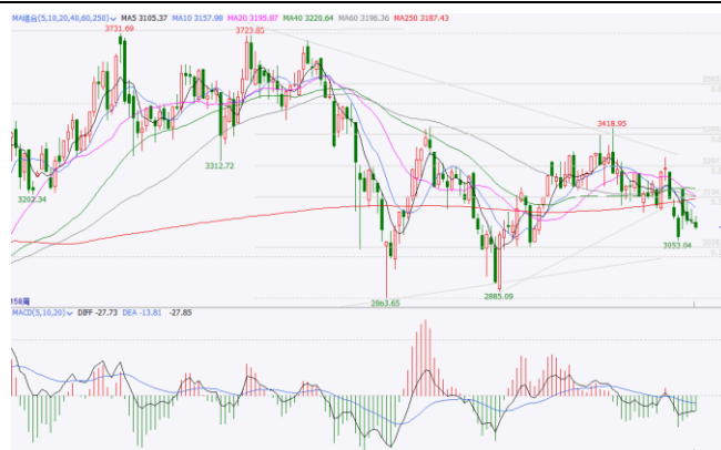
图 6.上证指数周 K 线图