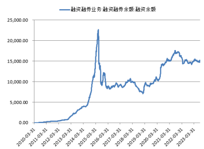
图 2. 沪深两市融资余额（亿元）