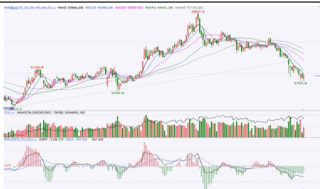
图 5. IF 加权周 K 线图

周线方面，IF加权反弹受到5周线的压制，均线簇空头排列，周线级别的下跌趋势没有改变。短期或进入波段寻底阶段，关注前期低点3754一线支撑，若被有效跌破，需警惕继续探底的风险。