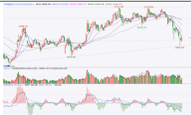
图 6. 上证指数周 K 线图