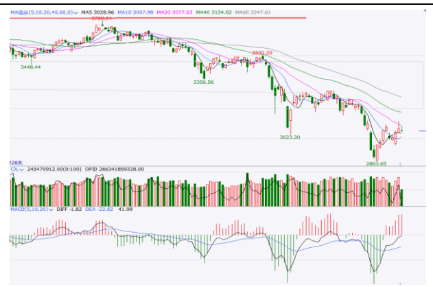
图 6. 上证指数日 K 线图