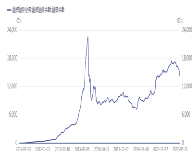
图2. 沪深两市融资余额变化