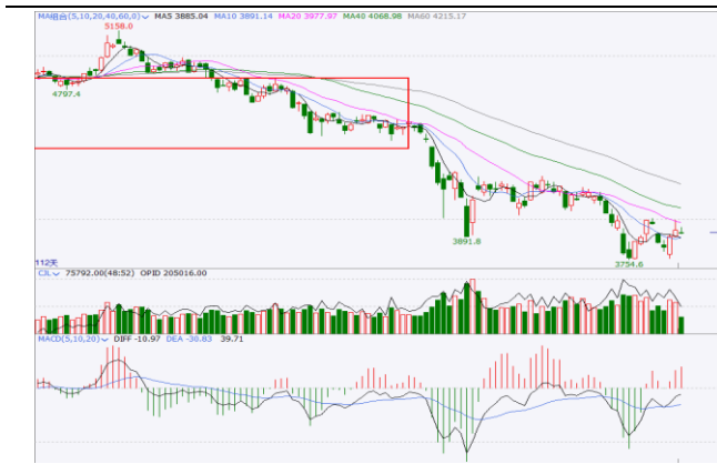
图 5. IF 加权日 K 线图