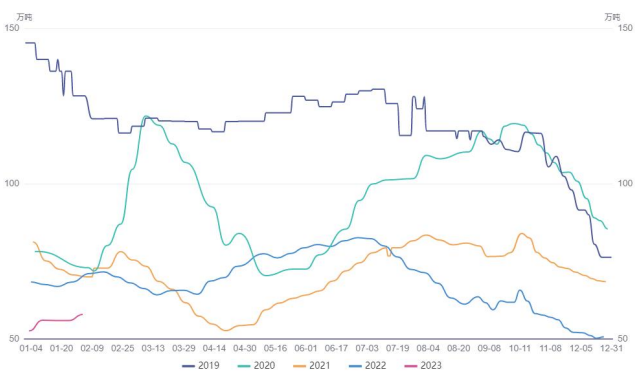
图 3. 豆油港口库存季节性分析

截止 2023 年 1 月 31 日，棕榈油港口库存为 99.45 万吨。从季节性来看，棕榈油港口库存位近 5 年同期最高水平。