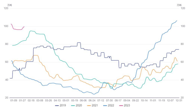
图 4. 棕榈油港口库存季节性分析