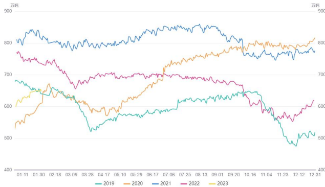
图 1. 进口大豆港口库存季节性分析

截止 2023 年 1 月 27 日，油厂豆粕库存为 51.94 万吨。从季节性来看，豆粕库存位于近 5 年同期中等水平。