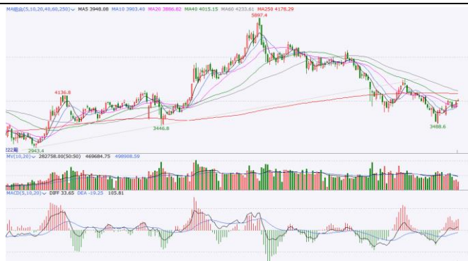
图 5.IF 加权周 K 线图

周线方面，IF加权连续3周反弹，站上40周线，但上方面临4120-4200平台压力，预计短期向上突破的难度较大，警惕震荡回调风险。