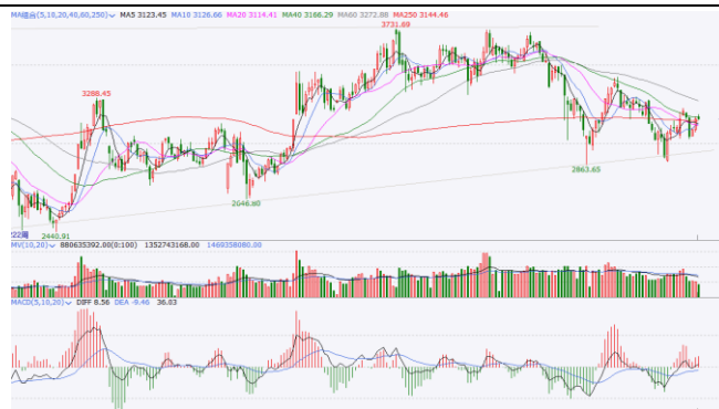
图 6.上证指数周 K 线图