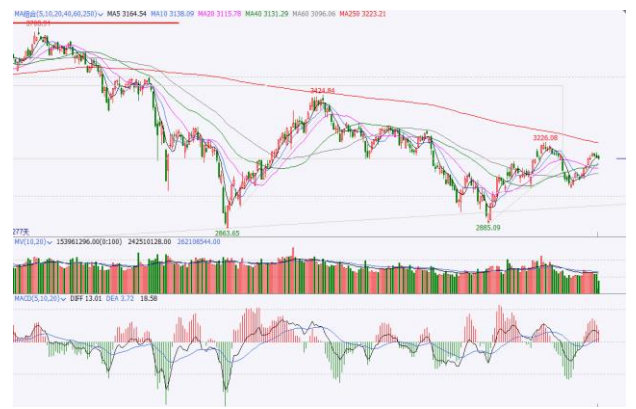
图 6. 上证指数日 K 线图