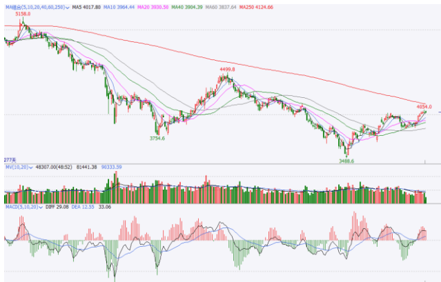
图 5. IF 加权日 K 线图

日线方面，IF 加权沿 5 日线向上运行，连续反弹并突破前期高点 4020 一线压力，但上方面临年线压力，短期若不能有效突破，需防范再次回落风险。