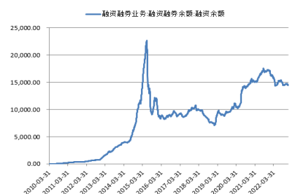
图 2. 沪深两市融资余额变化