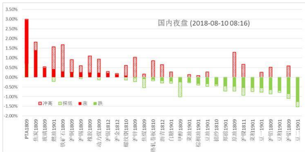
(注：相对昨收盘价计算)