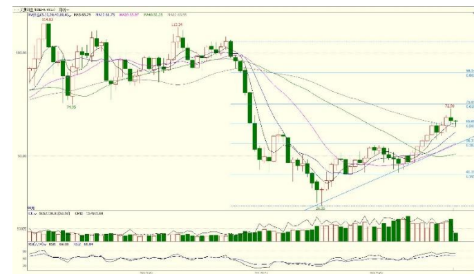
图 3. WTI 主力日 K 线图