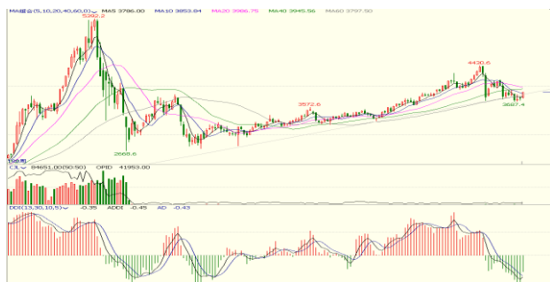
图 4. 上证指数周 K 线图