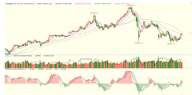
图 6.上证指数日 K 线图