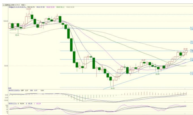
图 2.WTI 主力月 K 线图