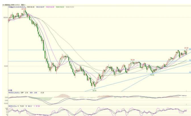
图 3. WTI 主力周 K 线图