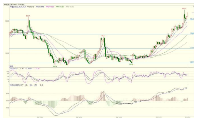
图 3. ICE 期棉指数日线图