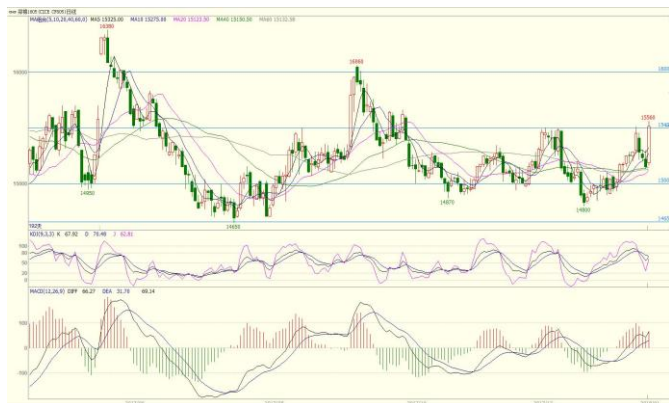
图 2. CF1801 日线图

从美棉指数日 K 线图上看，期价连续两个月反弹，累计涨幅达 20%，本周强势突破 80 美分压力，但 KDJ 指标高位粘合形成顶背离，短线提防高位调整。