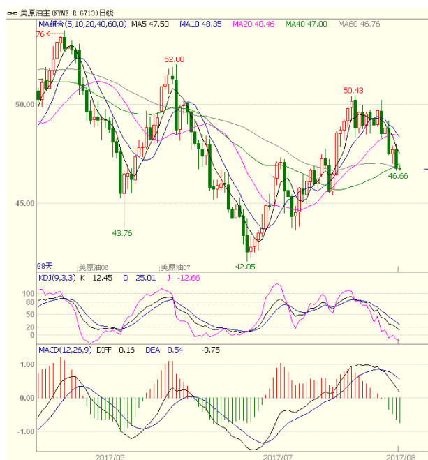
图1 美原油主力合约

本周美国能源信息署(EIA)公布的数据显示,截至8月11日当周,美国原油库存下降894.5万桶至4.665亿桶,预期减少320万桶,前值为减少645.1万桶。库欣地区原油库存增加67.8万桶至5704.7万桶,前值为增加56.9万桶。美国炼厂产能利用率下降0.2%至96.1%,高于市场预期的95.7%。不过上周周美国原油产量升至2015年7月以来最高水平,市场对供给端忧虑上升。预计美原油短线运行区间45.0-48.6。