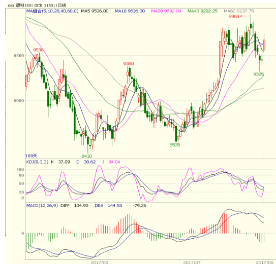
图 3 LLDPE1801 合约日线图