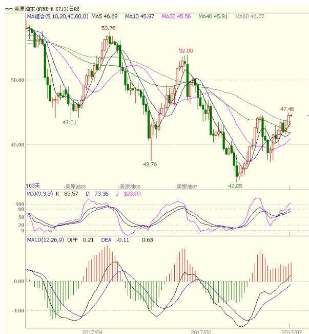
图 1 美原油主力合约

本周美国能源信息署 (EIA) 公布的数据显示，截至 7 月 14 日当周原油库存减少 472.7 万桶，为十五周以来的第 12 次下调，好于预期的降幅 346.28 万桶。馏分油库存减少 210 万桶，汽油库存减少 440 万桶，好于预期。沙特阿拉伯称可能将原油出口削减 100 万桶。近期美元走势偏弱，也给原油带来支撑，预计短线运行区间 45.5-49.5。