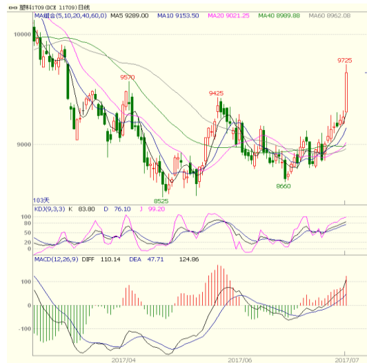
图 3 LLDPE1709 合约日线图