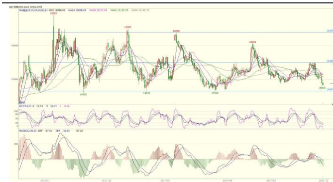
图 2. CF1801 日线图