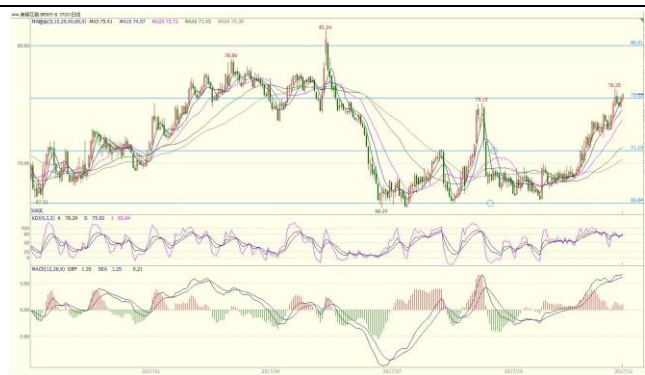
图 3. ICE 期棉指数日线图