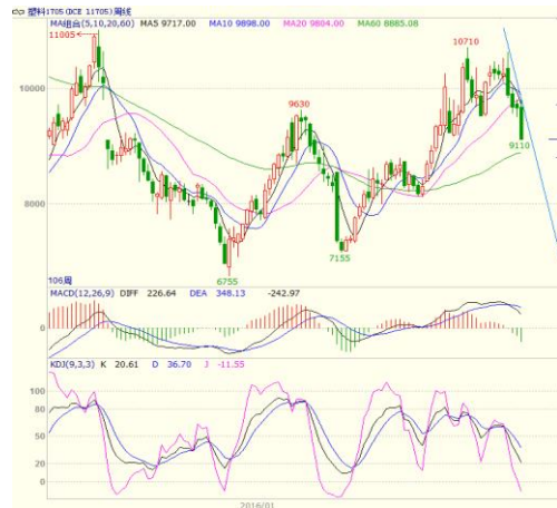
图 3 LLDPE1705 合约周线图