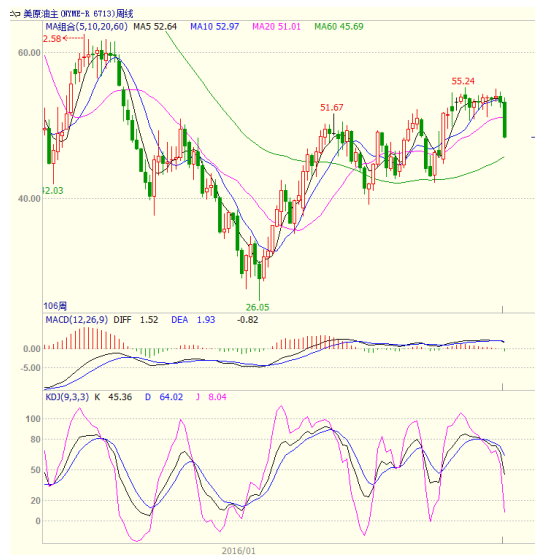
图1 美原油主力合约周线图

本周美国能源信息署(EIA)公布的数据显示,截至3月3日当周,美国原油库存增加820万桶,录得九连增,总库存量达5.284亿桶。美国油服贝克休斯公布的数据显示截至3月10日当周美国活跃钻井数增加8座至617座,创2015年9月以来新高,进一步延续长达9个月的上升趋势。本周原油走势震荡,至收盘美原油周K线下跌9.04%,收出大阴线。