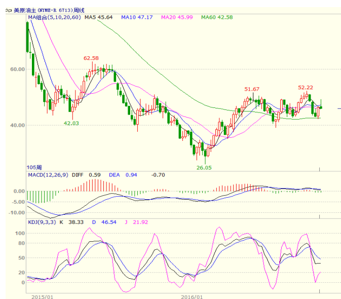
图 1 美原油主力合约周线图

8.7 万桶，结束此前的三连增。美国油服贝克休斯公布的数据显示，截至 2016 年 11 月 25 日当周美国石油活跃钻井数增加 3 座至 474 座，近期美国钻井平台数量总体在不断复苏，预示着美国原油生产可能走向活跃。欧佩克将于 11 月 30 日召开维也纳会议，讨论让各方满意的减产协议细节，市场对其关注度提高。至收盘美原油周 K 线冲高回落下跌 0.78%，收出带长上影小阴线，收盘在 5 周均线附近，关注下周欧佩克会议对油价的影响。