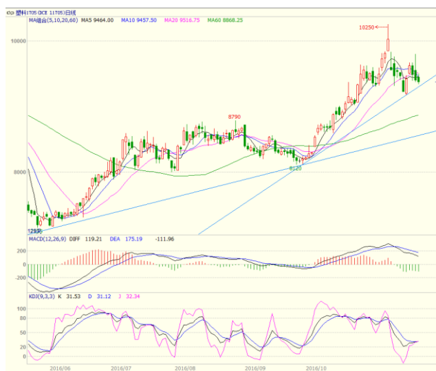
图3 LLDPE1705 合约日线图

压力仍大。周一低开高走收出中阳线、周二跳空高开收出小阳线、周三收出小阴线，周四收出带长上影阴线，周五小幅走低收出小阴线。最终周线收出带长上影小阳线。均线方面，周二、周三运行于5日均线之上，但周四跌破5日均线，周五收于5日均线之下，上方压力仍大。周线上，上影线上破5周均线，但至收盘仍收于5周均线之下。