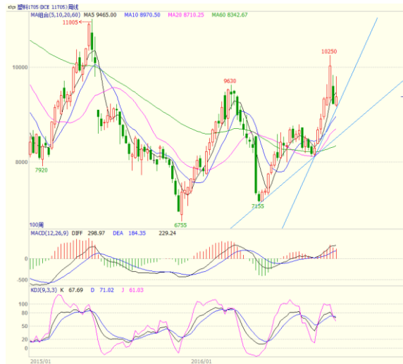
图 4 LLDPE1705 合约周线图