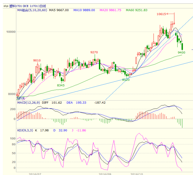
图 3 LLDPE1701 合约日线图

1701 合约本周大幅走低，收出近乎光头光脚的大阴线，显示在前期大涨后，获利盘套现动力增加，上方压力增大。周一大幅低开收出小阴线、周二收出带长上下影的中阳线、周三高开震荡收出小阴线，周四震荡走低收出小阴线，周五低开低走收出中阴线。最终周线收出近乎光头光脚的大阴线。均线方面，周一低开跌破 5、10 日均线支撑，周线上，收盘跌破 5 周均线，不过下方 10 周均线有一定支撑。