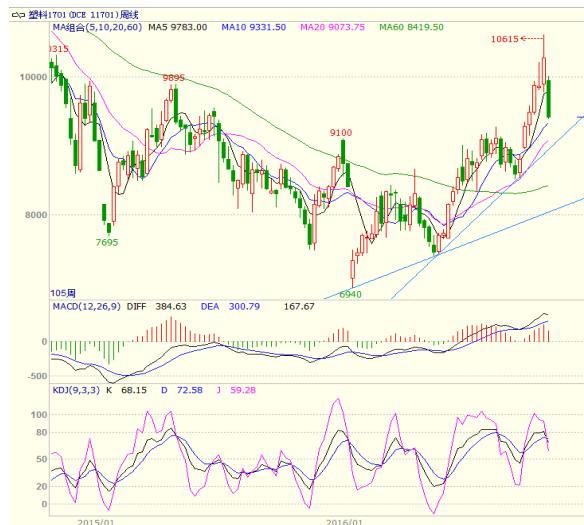
图 4 LLDPE1701 合约周线图