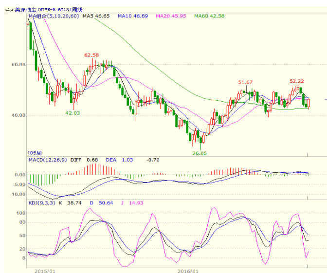
图1 美原油主力合约周线图

大，预期增加4.0万桶。美国油服贝克休斯公布的数据显示，截至2016年11月18日当周美国石油活跃钻井数增加19座至471座，为2015年7月以来最大单周增幅，重返9个月高点且在过去25周内，有22周录得上升，油价反弹和特朗普当选鼓舞了美国页岩油的增产信心。欧佩克将于11月28日在维也纳与非OPEC国家召开会议，市场对其关注度提高。至收盘美原油周K线收盘上涨7.42%，收出中阳线，上方5、10周均线承压，短线有企稳迹象。