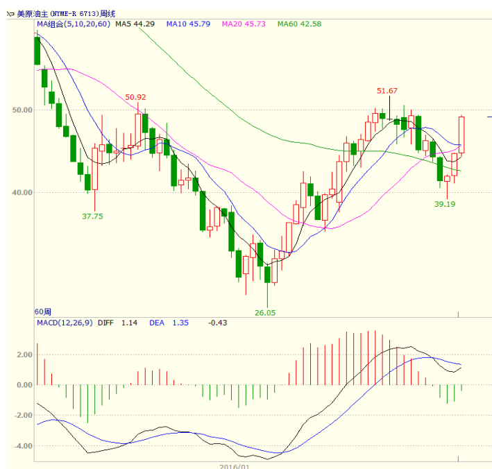
图1 美原油主力合约周线图

本周美国能源信息署(EIA)公布的数据显示,截至8月12日当周,美国EIA原油库存下降251万桶,至5.2109亿桶;美国汽油库存减少272万桶,至2.3266亿桶;备受市场关注的库欣地区原油库存下降72.4万桶,至6453.1万桶。美国油服贝克休斯公布的数据显示,截至2016年8月12日当周美国石油活跃钻井数增加10座至406座,为连续第八周增加,过去12周内11周录得增长。至收盘美原油周K线收盘上涨9.91%,收出大阳线,收盘站上10、20日均线,短线走势强劲。