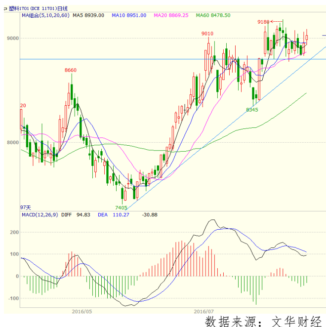
图3 LLDPE1701 合约日线图

上，下方均线形成支撑，且5日均线拐头向上，有上穿10日均线之势。周线上，5、10、20周均线继续走高，下方5周均线支撑较强。