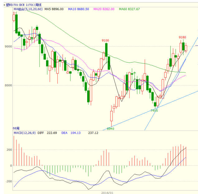
图 4 LLDPE1701 合约周线图