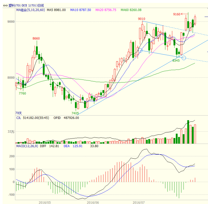
图 3 LLDPE1701 合约日线图