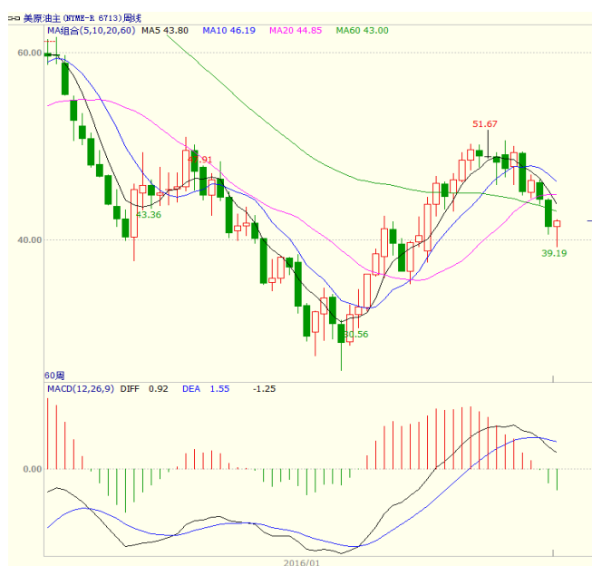
图1 美原油主力合约周线图

本周美国能源信息署(EIA)公布的数据显示,截至7月29日当周,美国EIA原油库存增加141万桶,至5.2255亿桶;美国汽油库存总量2.3819亿桶,比前一周下降326万桶;备受市场关注的库欣地区原油库存6409.2万桶,比前周减少112.3万桶。美国油服贝克休斯公布的数据显示,截至2016年8月5日当周美国石油活跃钻井数增加7座至381座,为连续第六周增加,过去十周内九周录得增长。至收盘美原油周K线收盘上涨1.45%,收出小阳线,上方5、10日均线承压,短线震荡走势。