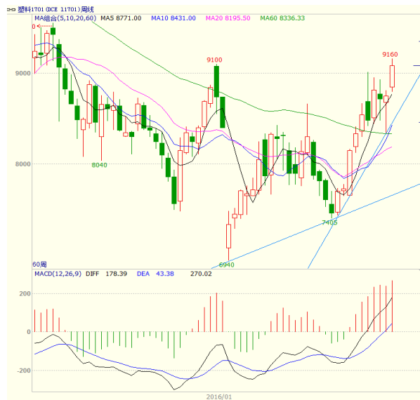
图 4 LLDPE1701 合约周线图