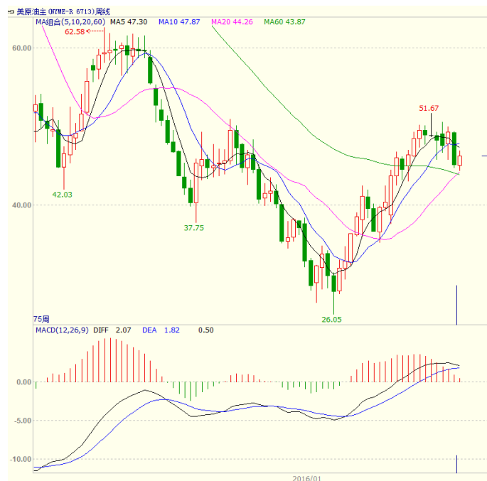
图 1 美原油主力合约周线图

当周，美国 EIA 原油库存减少 254.6 万桶，至 4.99 亿桶，连续第八周减少，但降幅不及预期；原油交割地库欣库存减少 23.2 万桶，至 6392 万桶。美国油服贝克休斯公布的数据显示，截至 2016 年 7 月 15 日当周美国石油活跃钻井数增加 6 座至 357 座，为连续第三周增加。周二时由于市场预计非欧佩克产量下降，原油价格大涨，但周三公布的美原油库存下降不及预期且美国汽油库存意外增长，周三时油价又大幅下挫，周四、周五油价则小幅走高。至收盘美原油周 K 线收盘上涨 2.57%，收出小阳线，下方 20 周均线处有一定支撑。