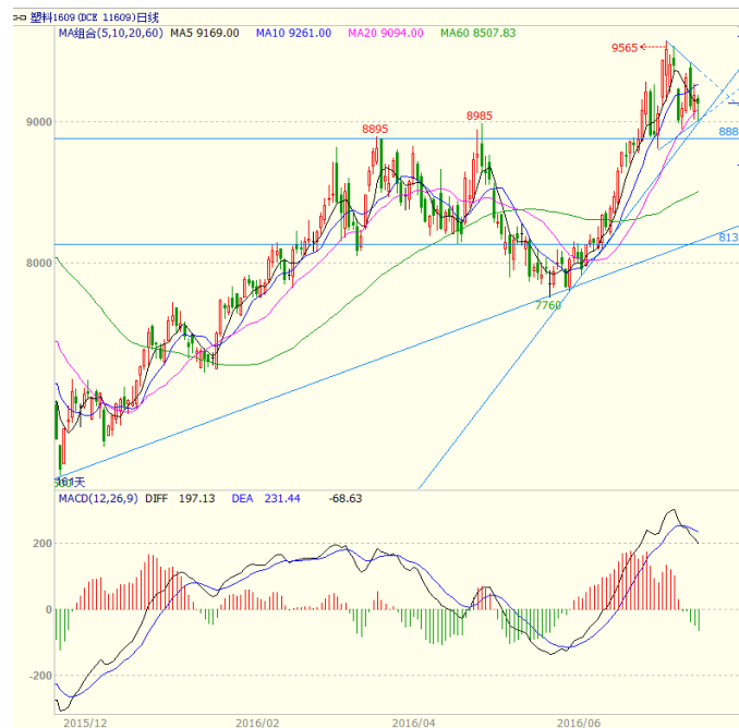
图 3 LLDPE1609 合约日线图

开探低回升收出带长下影的小阴线，最终周线收出实体较短，上影线较长的小阳线。均线方面，周一在 20 日均线附近获得支撑回升、周二收盘曾站上 10 日均线，但周三走低跌破 10 日均线，周四、周五继续受到 10 日均线的压制。周三时 5 日均线下穿 10 日均线。周线上，5、10、20 周均线继续走高，本周探低至 5 周均线附近获得支撑，10 周均线有上穿 20 周均线的趋势。关注后期 5 周均线对价格的支撑力度。