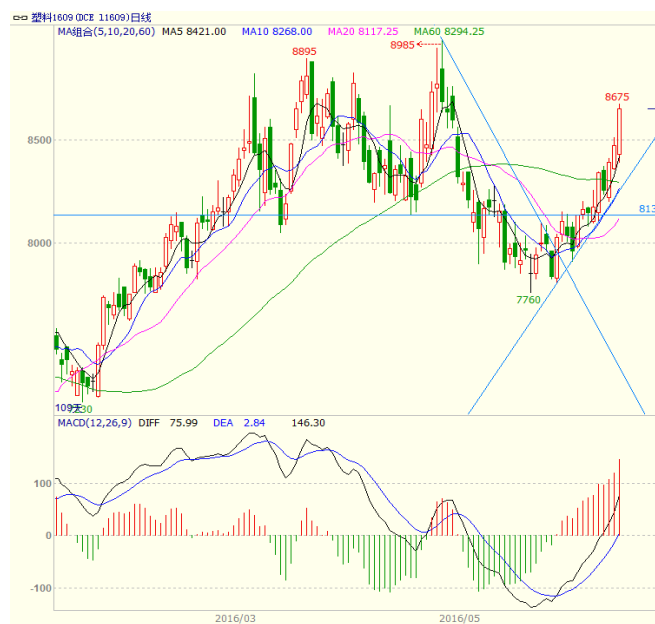
图3 LLDPE1609 合约日线图

低走收出小阴线、周三低开高走收出中阳线、周四低开高走收阳、周五低开高走收出大阳线，最终周线收出实体较长，上下影线较短的大阳线。均线方面，虽然周一、周三低开在5日均线之下，但低开后皆走高站上5日均线，下方均线对价格支撑明显。同时5、10、20日均线形成多头排列，对价格形成支撑。周线上，5、20周均线继续走高，10周均线结束此前下行走势，拐头向上，但60周长期均线继续下行。本周大幅走高站上10、20、60日均线，下方均线对价格形成支撑