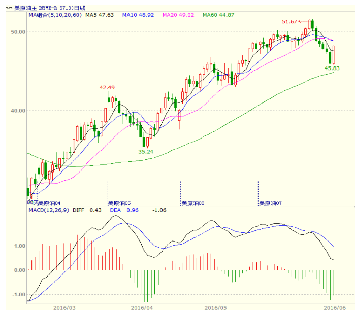
图1 美原油主力合约价格走势

本周美国能源信息署(EIA)公布的数据显示,截至6月10日当周,美国EIA原油库存减少93万桶,至5.3154亿桶;库欣原油库存增加52.5万桶,前值减少70.4万桶;美国原油日均产量871.6万桶,比前周日均产量减少2.9万桶,比去年同期日均产量减少87.3万桶;截止6月10日的四周,美国原油日均产量874.1万桶,比去年同期低8.8%。美国油服贝克休斯公布的数据显示,美国至6月17日当周石油钻井总数增加9口,为337口,连续3周上升,美国页岩油生产商产出活动恢复进一步得到确认。本周前四个交易日原油连续下跌,但周五在美元走弱和英国脱欧忧虑缓解情况下大幅走高,至收盘美原油周K线收盘下跌1.27%,收出带长下影的小阴线,显示下方支撑较强。