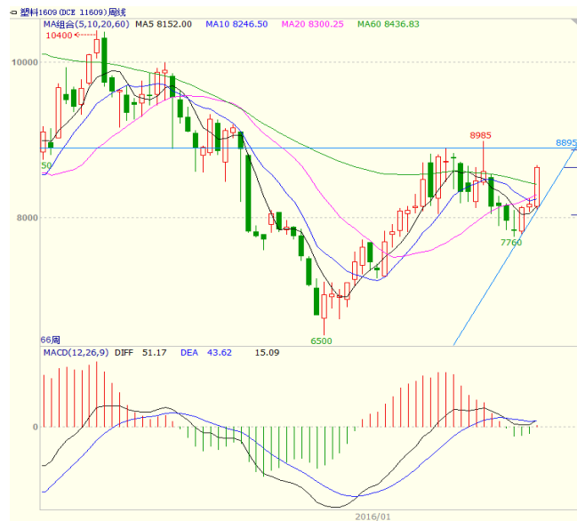
图 4 LLDPE1609 合约周线图