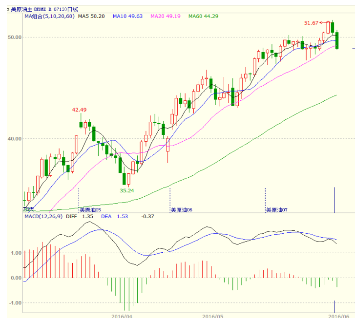
图1 美原油主力合约价格走势

本周美国能源信息署(EIA)公布的数据显示,截至6月3日当周,美国EIA原油库存减少322.60万桶,预期减少313.89万桶,前值减少136.60万桶;库欣原油库存减少136.3万桶,预期减少63.55万桶,前值减少70.4万桶。随着油价回升至50美元/桶附近,页岩油生产商将钻机重新投入生产。美国油服贝克休斯公布的数据显示,美国至6月10日当周石油钻井总数增加3口,为328口。因尼日利亚武装袭击事件及美元走弱,本周前三个交易日美原油价格走高,但周四、周五美元走弱,且数据显示美国原油钻井数增加,美原油冲高后回落,至收盘美原油周K线收盘下跌0.04%,收出长上影,上方压力增大。