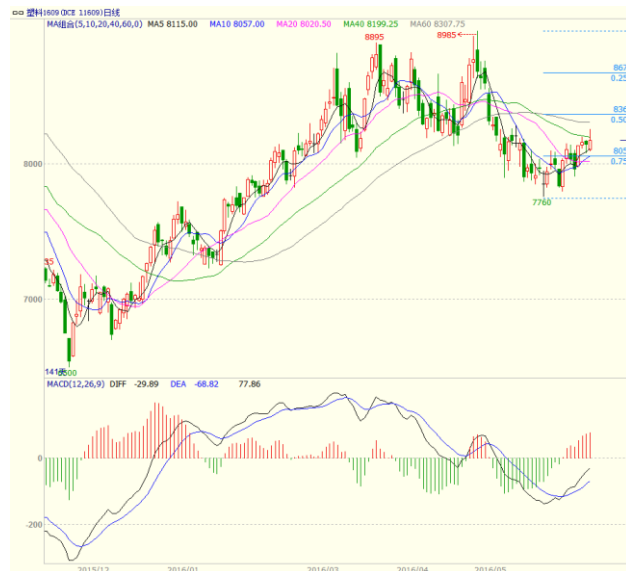
图3 LLDPE1609 合约日线图

到支撑。周一收出带长上下影的小阳线、周二探低回升收出带长下影的小阴线、周三低开冲高回落收出带长影的阳线，最终周线收出实体较短的小阳线。均线方面，周一运行于5、10、20日均线之上，周二短暂跌破5日均线后拉起，周三在5日均线附近低开获得支撑走过。本周一10日均线上穿20日均线，5、10、20日均线形成多头排列，对价格形成支撑。周线上，本周一度冲破10周均线压力，不过至收盘回落，仍在10周均线之下。5周均线结束此前向下走势，略微向上拐头，但上方10周均线继续下行，对价格形成压制。