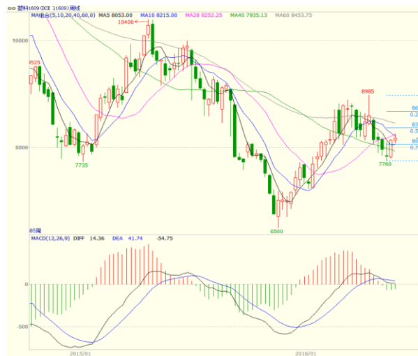
图 4 LLDPE1609 合约周线图