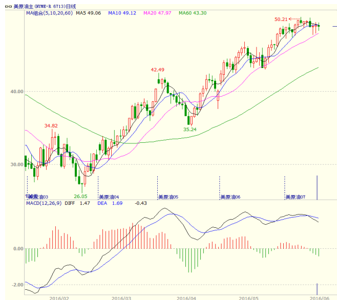
图1 美原油主力合约价格走势

本周欧佩克会议在维也纳召开，各成员国未能就设置新的产量上限达成一致，石油输出国组织将坚持其无约束的石油生产政策。美国原油库存、汽油库存和馏分油库存全面下降。美国能源信息署数据显示，截止5月27日当周，美国商业原油库存量5.357亿桶，比前一周下降137万桶。备受市场关注的美国库欣地区原油库存比前周减少了70.4万桶。石油服务提供商贝克休斯发布的报告显示，美国本周活跃石油钻井平台数量增加9座，为325座。美原油本周走势震荡，至收盘美原油周K线收盘下跌1.33%，收出小阴线，短线走势震荡。