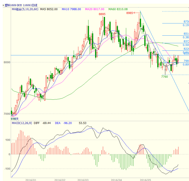
图3 LLDPE1609 合约日线图

周连跌走势。周一大幅走高收出中阳线、周二高开高走收出小阳线、周三低开后震荡走低收出小阴线、周四高开低走收阴，周五高开高走收出几乎光头光脚的中阳线，最终周线收出实体较长，上下影线较短的中阳线。均线方面，周一大幅走高收在5、10日均线之上，周二收高站上20日均线，周四走低收在5、10、20日均线之下，周五重新走高收在5、10、20日均线之上。本周5日均线上穿10日均线，周五时5日均线向上穿越20日均线，均线系统对价格形成支撑。周线上，本周低开高走收盘站上5周均线，不过5、10周均线继续向下运行，上方10周均线8275一线有一定压力。