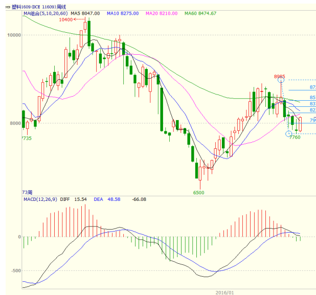
图 4 LLDPE1609 合约周线图