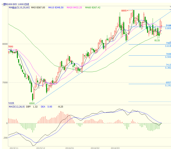
图 3 LLDPE1609 合约日线图

1609 合约本周周一至周三走势震荡，周四大幅走高收出大阳线，但周五大幅低开收出带长上下影小阳线，最终周线收出低开高走的小阳线，在商品普遍上涨的背景下，塑料多方借势走高，但由于基本面支撑有限，涨幅有限。均线方面，周一至周三基本运行在 5、10、20 日均线之下，周四一根大阳线站上 5、10、20 日均线。周线上，本周低开高走站上 10 周均线，但上方 5 周均线拐头向下，对价格形成压制。