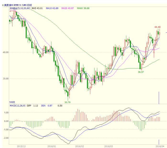
图 1 美原油主力合约价格走势

本周美国能源信息署数据显示，截止 4 月 15 日当周，美国商业原油库存量 5.3861 亿桶，比前一周增长 208 万桶，库欣地区原油库存减少 24.8 万桶，至 6430.3 万桶。石油服务提供商贝克休斯发布的报告显示，美国本周活跃石油钻井平台数量较上周减少 8 座，至 343 座，连续第五周减少，创 2009 年 10 月以来的最低水平。多哈会议未能达成冻产协议，美原油本周低开，但是科威特工人罢工且美原油库存增长逊于预期，美原油低开后走高，至收盘美原油周 K 线收盘上涨 4.79%，收出低开中阳线，短线震荡偏强走势。