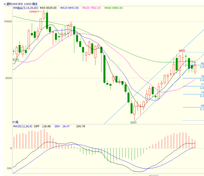
图 4 LLDPE1609 合约周线图