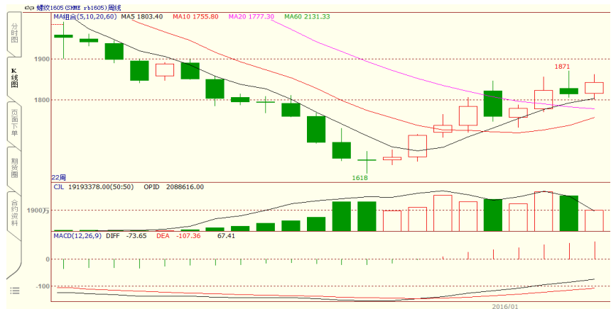
图 2 螺纹 1605 合约周 K 线

从周线周期看，螺纹 1605 合约延续反弹格局，本周减仓缩量拉涨 29 点，即涨幅 1.6%，维持于 5 周和 20 周均线，中阳线稳站短期均线之上，期价交投重心逐步脱离前期低位。尽管短线期价涨势良好，并且目标看至 1900 点之上，中线仍未脱离熊市格局。