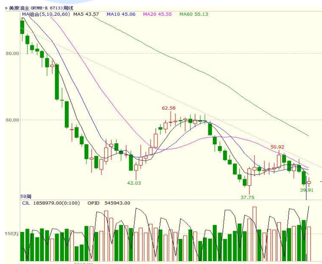
图 1 美原油主力合约价格走势

本周美国能源信息署数据显示，截止 11 月 13 日当周，美国商业原油库存量 4.8729 亿桶，比前一周增长 25 万桶；库欣地区原油库存增加 149.5 万桶，增加幅度 2.7%。虽然上周美原油库存增长数据低于预期，但是当前原油供给充裕，库存处于历史高位，而明年对伊朗的制裁解除后，其产量将有效增加市场供应量。IHS 负责化工领域的总经理 David Witte 曾表示制裁取消后，伊朗将新增原油产量和出口总计 100 万-120 万桶/日；对伊朗的国际制裁料将在 2016 年 4 月至 6 月间取消。在上周大幅下跌后，本周原油波动幅度缩减，至收盘美原油周 K 线收盘上涨 1.79%，收出带上下影的小阳线，总体走势仍偏弱。