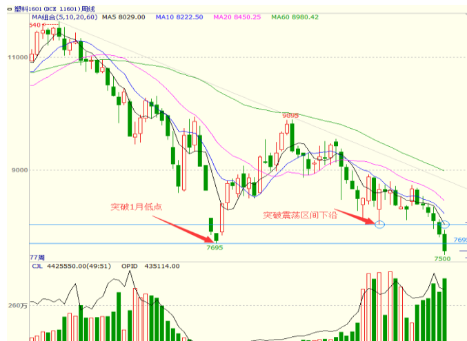
图 4 LLDPE1601 合约周线图