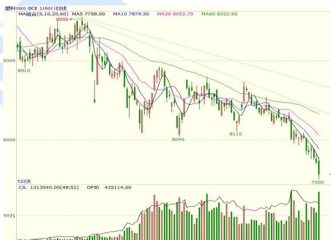
图 3 LLDPE1601 合约日线图

1601 合约本周前两个交易日小幅震荡，后三个交易日连收三阴，尤其是周五的阴 K 线实体放大，显示空头力量增加，有加速下跌的迹象，而上方 5、10、20 日均线空头排列，上方压力重重。周线以跌幅高达 295 点的大阴线报收，至本周已连跌 6 周，近 5 根周 K 线实体依次放大，空头力量仍主导市场。周线、月线均线亦呈空头排列，空头格局下，走势易跌难涨。