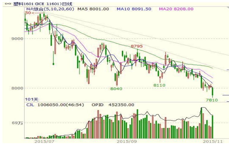
图 2： LLDPE1601 合约日线图