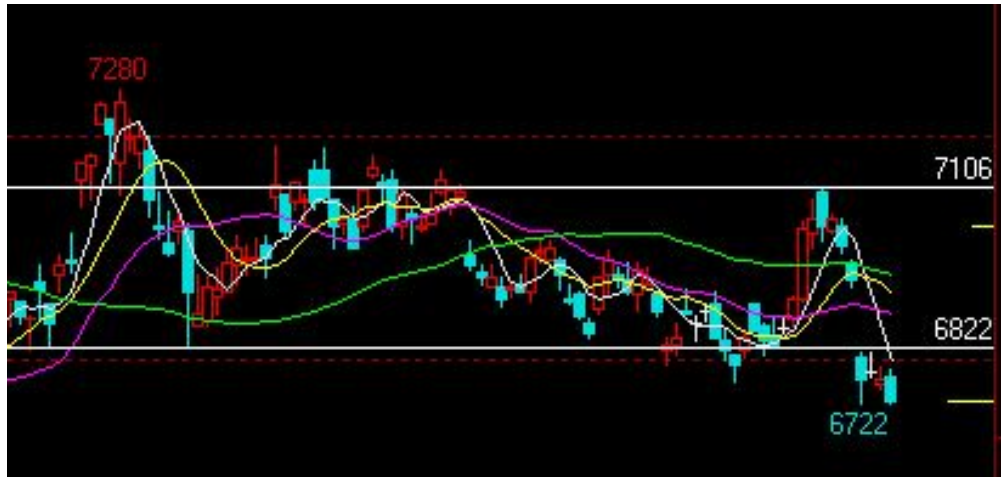
图三、连豆油主力合约：复杂的箱体震荡，形势不容乐观

技术说明：近 300 点的区间被跌穿，豆油仍处于复杂的震荡过程中，6800 未能收复，则面临改写年内新低的威胁。