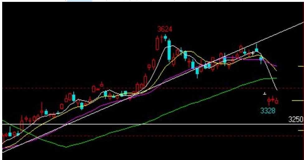
图四、连粕主力合约：空头市场仍待寻底

技术说明：近 300 点的区间被跌穿，豆油仍处于复杂的震荡过程中，6800 未能收复，则面临改写年内新低的威胁。