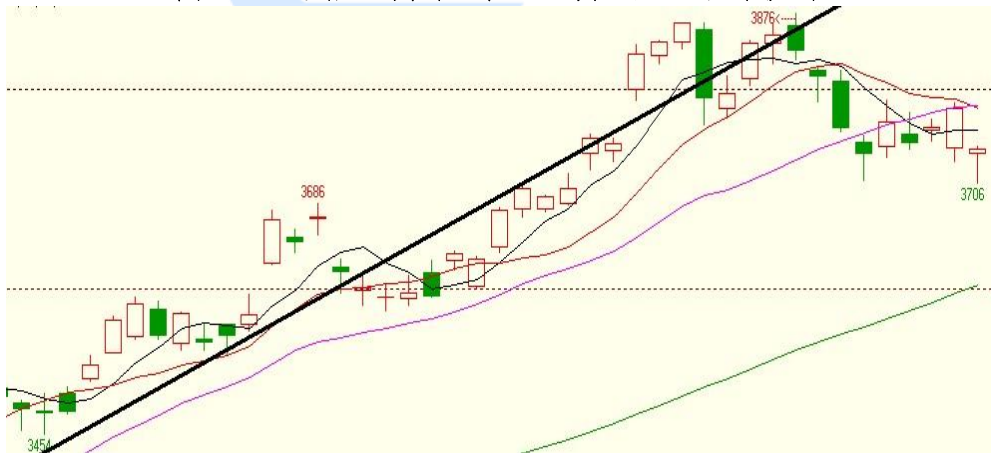
图四、连粕主力合约：上升通道遭到破坏

技术说明：豆油持续在下降通道之中，但短期 6750 下跌无量，存在反抽回试下降通道压力要求。