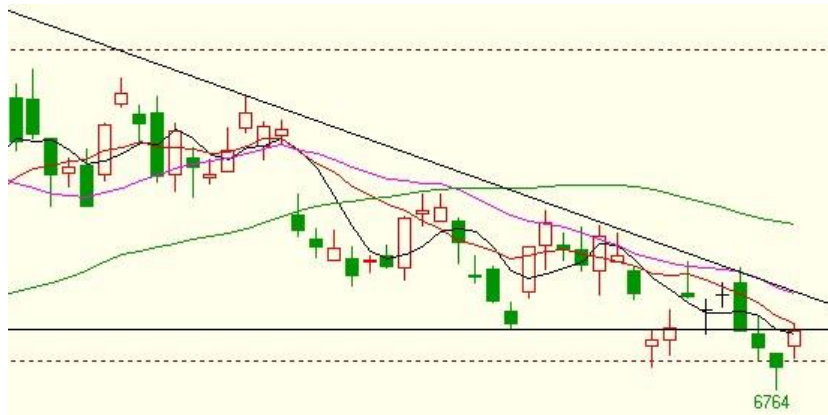
图三、连豆油主力合约：下降通道将面临考验

技术说明：豆油持续在下降通道之中，但短期 6750 下跌无量，存在反抽回试下降通道压力要求。