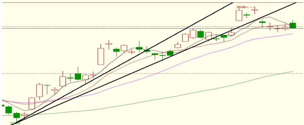
连粕 9 月合约日线图：上升技术通道面临考验

技术说明：政策抛出的释放，技术顶部的压力，仍在加大，下周若失手 4280，仍面临百点以上的下沉，短线交易思路。