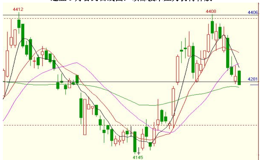
连豆 9 月合约日线图：顶部技术压力仍待释放

技术说明：政策抛出的释放，技术顶部的压力，仍在加大，下周若失手 4280，仍面临百点以上的下沉，短线交易思路。