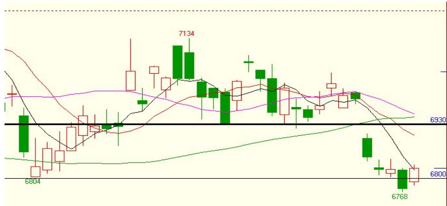
连豆油 9 月合约日线图：面临重要方向选择

技术说明：6800 是重要防线，一经有效跌穿将打开更大的下降空间（300 点左右），反之，支撑有效价格将出现回升，USDA 报告将是重要的指引。