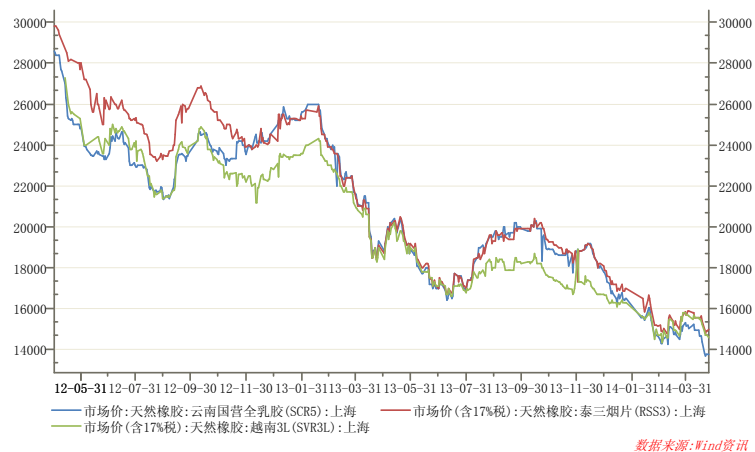
图 1 上海市场天然橡胶价格

国内外产区全面开割，市场供应压力逐渐明显。本周天胶现货市场价格弱势下跌，市场观望情绪较浓。截止4月25日，上海地区天然橡胶市场，云南国营全乳胶市场报价13700元/吨，较上周五下跌650元/吨；泰三烟片17税市场报价15000元/吨，较上周五下跌400元/吨；大厂越南3L含17%税市场报价在14600元/吨左右，较上周五下跌650元/吨。