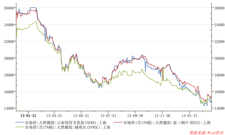
图1 上海市场天然橡胶价格

本周天胶现货价格弱势下跌，下游轮胎销售未有明显改观。截止3月21日，上海地区天然橡胶市场，云南国营全乳胶市场报价14600-14700元/吨，较上周五下跌400-500元/吨；泰三烟片17税市场报价15300-15400元/吨，较上周五下跌300-400元/吨；越南3L含17%税市场报价在15200元/吨左右，较上周五下跌300元/吨。