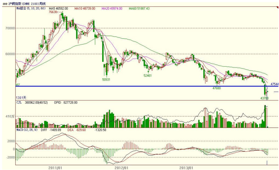
沪铜指数周 K 线图