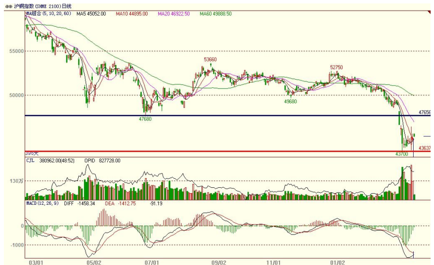
沪铜指数日 K 线图

本周铜低位震荡。沪铜指数上半周窄幅波动，周四剧烈震荡，获得本周的最高点和最低点，盘中最低下探至 43760 后展开强势反弹，最高触及 46420 点回落，周五在周四的运行区间内波动，周线小幅收涨；伦铜本周探底回升，最低跌至 6321 点，创 2010 年 7 月初以来的新低，随后展开强势反弹，最终周线报收十字星。技术上看，期价中线空势不改，短线低位企稳震荡。