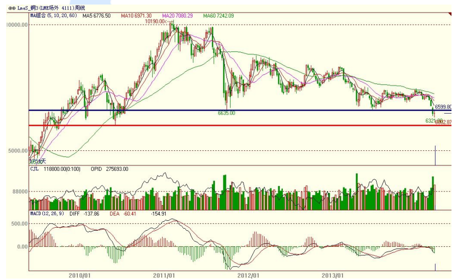
伦铜电3周 K 线图