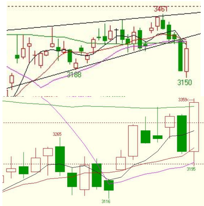
连粕 5、9 月合约周线图：对冲阳线，波动加剧