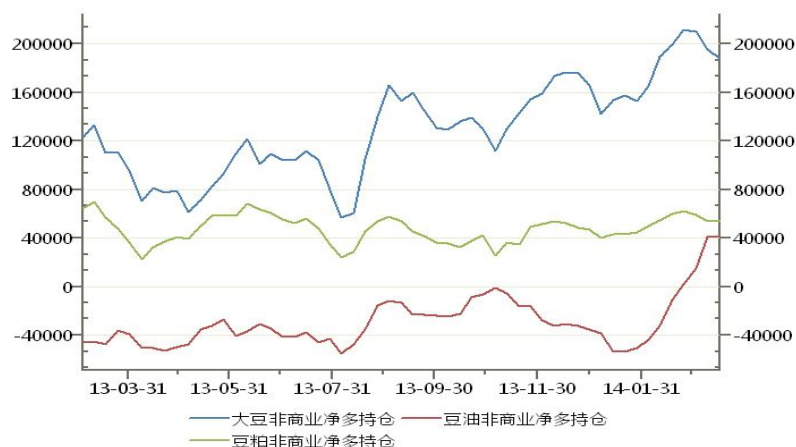
CFTC 豆类净多持仓变动图