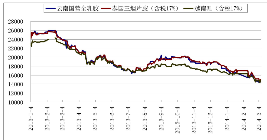
图1 上海市场天然橡胶价格

本周天胶现货价格先抑后扬，截止3月7日，上海地区天然橡胶市场，云南国营全乳胶市场报价14500元/吨，较上周五下跌150元/吨；泰三烟片17税市场报价15050元/吨，较上周五下跌150元/吨；越南3L含17%税市场报价在14900元/吨，较上周五上涨200元/吨。