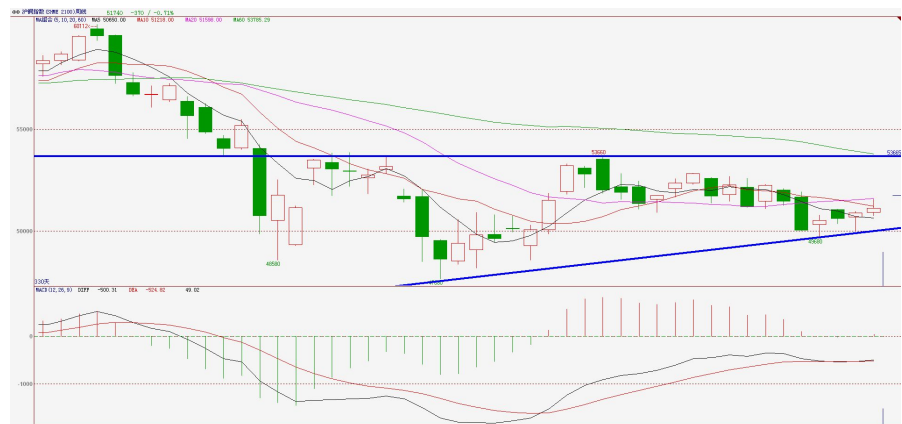
沪铜指数周 K 线图