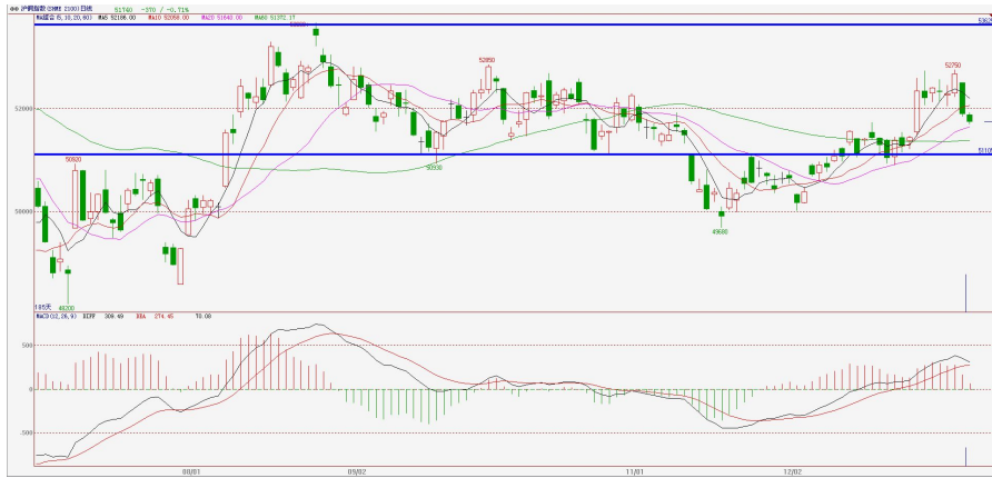
沪铜主力合约 1403 日 K 线图

周线上看，本周期铜冲高回落，伦铜沪铜均上触区间上沿后承压回落报收中阴线，伦铜最高触及 7460 点，创近 7 个月以来的新高，沪铜上涨力度明显不如伦铜，仅冲高至 52750 点便回落，最终报收在 5 周均线附近。