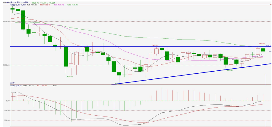
伦铜电3周 K 线图