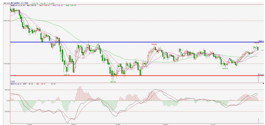
伦铜电3日 K 线图