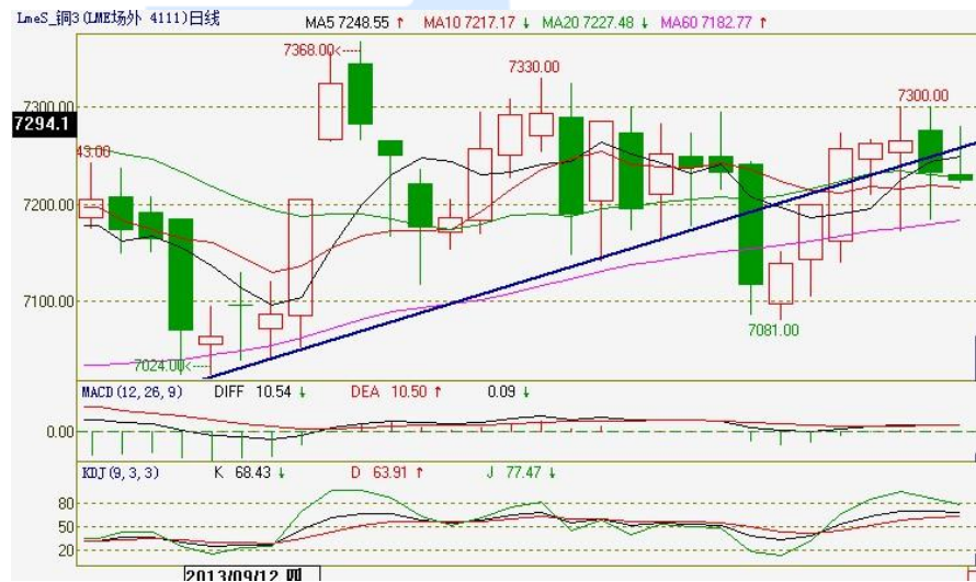
伦铜电 3 日 K 线图