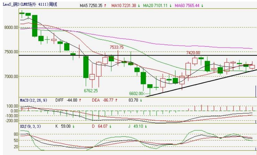
伦铜电 3 周 K 线图