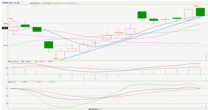
沪铜日 K 线图

周线上看，伦铜沪铜震荡区间均逐渐缩窄，目前没有明显趋势，只有震荡区间突破上方压力线和下方支撑线之后才会有明显趋势。日线上看，沪铜指数维持在 12 月 21 日自低位回升后形成的上涨趋势线之上运行，但 59000 一线压力较大，短期或维持区间震荡。建议密切关注 58000-58150 一线支撑情况以及 59000 压制情况。