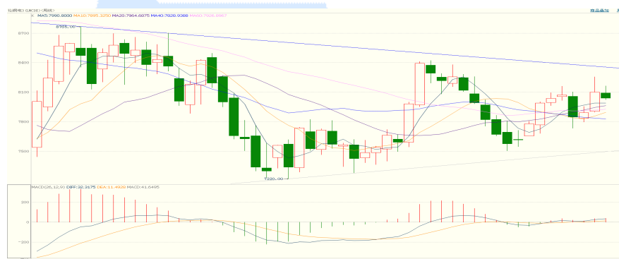
伦铜周 K 线图