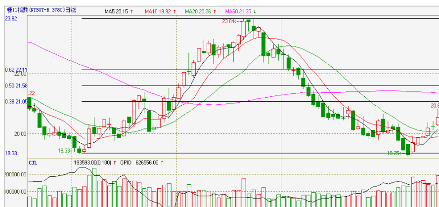
图 2 ICE11 号原糖指数启动次级反弹

美糖指数在 6 月初低点附近获得阶段支撑启动次级反弹，5 日线接连上穿 10 日、20 日线呈连续金叉，量能配合积极，预计反弹将上试前期跌幅的 0.38 回调压力位（21.05 美分），当前界定为日线周期次级反弹，非反转。