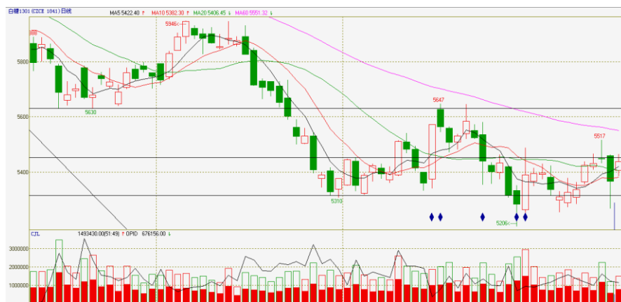
图 1 郑糖 1301 合约日线周期反弹节奏遭破坏

60 日线下行斜率与上述两个波峰的两点趋势线基本平行，当前日线周期反弹如若不突破 60 日线则不具备深化为中线底部的条件。