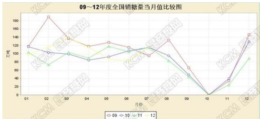
图 1 近四个榨季全国月度销糖量对比

市场对收储传言作出如此积极的回应是有根基的,通过对比近四个榨季月度销糖量可以看出本榨季食糖销售持续低迷,特别是二季度消费淡季,销糖量达到近几个榨季以来的低位,虽然 7 月份销售量有所回升,但在增产及进口量大幅增加的背景下,工业库存压力成为压制糖价的一座大山。