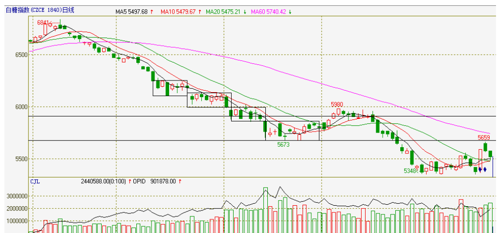
图2 郑糖指数低位楔形整理

5630至60日均线所在的5700整数关口这一压力区间是当前反弹深化的第一重要压力位，5700关口也是6月中下旬整理区间中轴，在攻击5700成功之前以低位宽幅震荡看待当前行情。