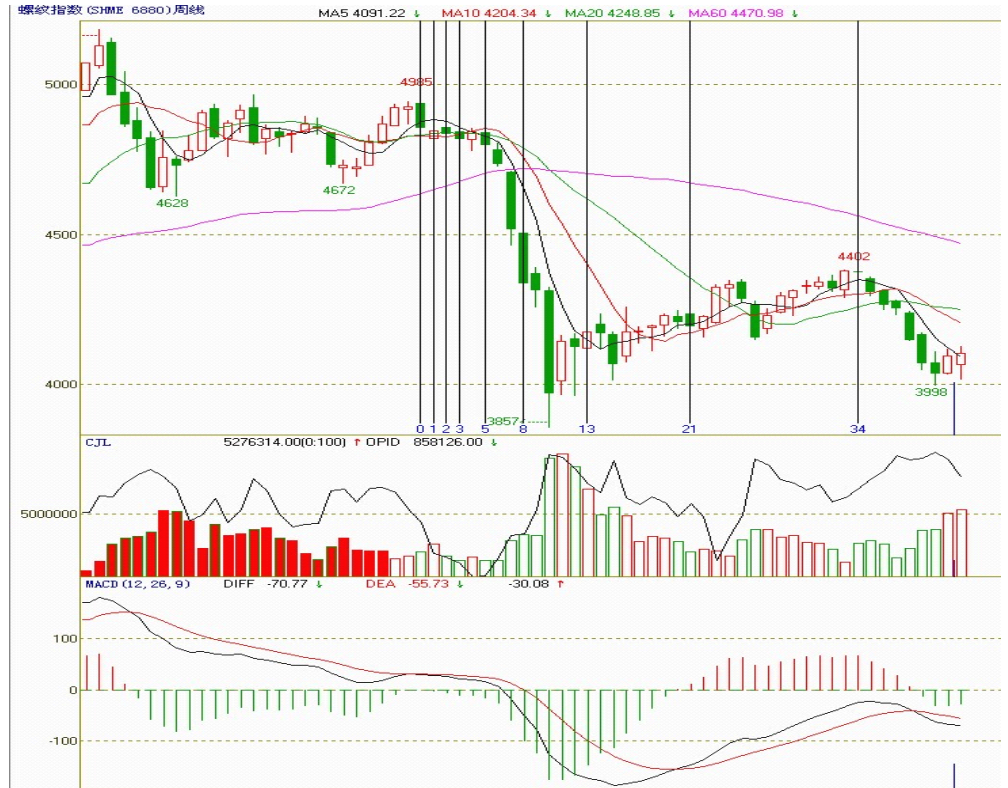
图二：螺纹指数周K线图

和影线长度来看，阳线实体长度较短，上下影线相当，多空双方激烈争夺；黑色竖线代表的是从去年8月以来的斐波那契周期线，从本周开始，螺纹期价迎来了一波探底回升行情，自第34周收出阴线十字星线后，期价在连续第六周小幅下挫后，近两周延续收阳线，有止跌的迹象；MACD指标“死叉”后向下发散，两线距离收窄，绿色能量柱小幅减少，量能继续放大；期价上底部支撑明显，依然仍有上行的动能。