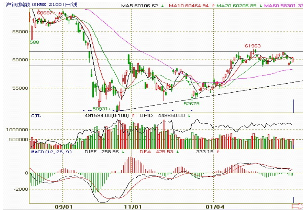
图二：沪铜指数日 K 线图

仓位有小幅减少；向右上方倾斜的斜线代表上升趋势线，支撑期价，短期内期价延续区间震荡的可能性大。