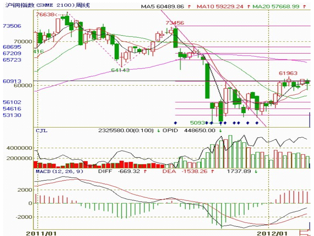
图三：沪铜指数周 K 线图

图三中右边红色横线的大势线划出的期价的压力支撑线，黑色横线为上方颈线压力线；前期颈线压力线与大势线一条压力线重合，压制期价；本周期价收于小阴线，较之前一周持仓量和成交量均小幅减少，量能萎缩，短期内期价或将延续震荡。