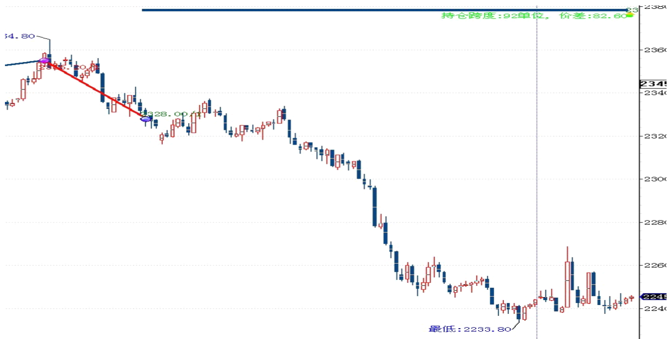
图表 2: 交易情况