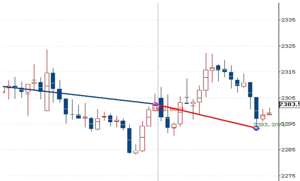
图表 2: 交易情况