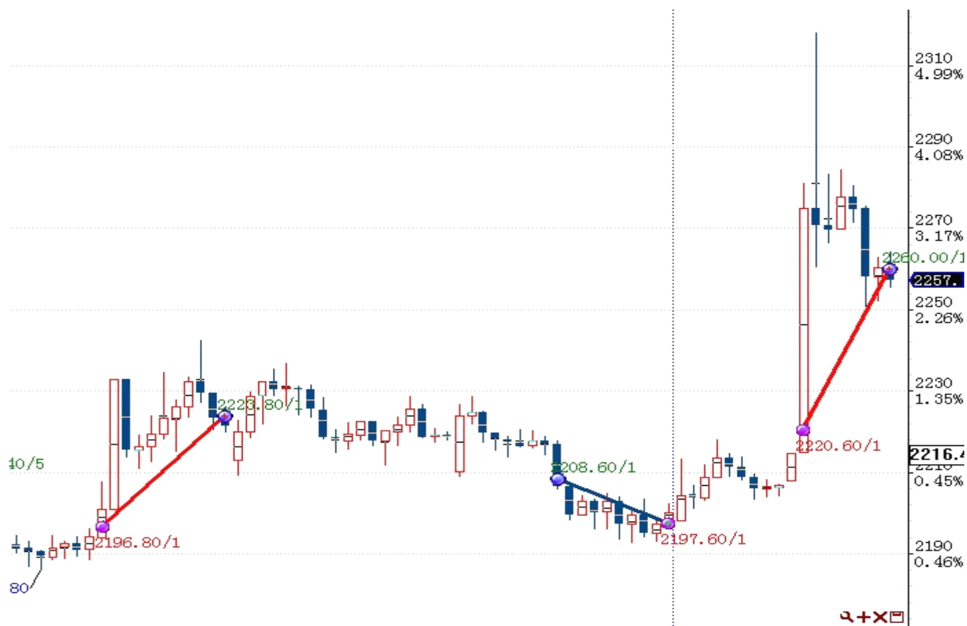
图表 1: 交易痕迹

初始资金 100 万, 起始日期: 2012年5月8日 截止 2012年9月27日, 总权益: 945219元