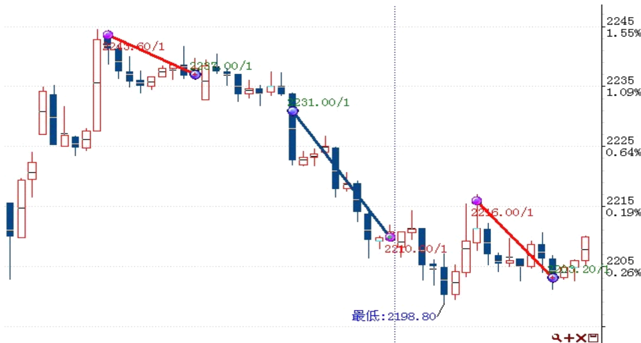
图表 2: 交易情况