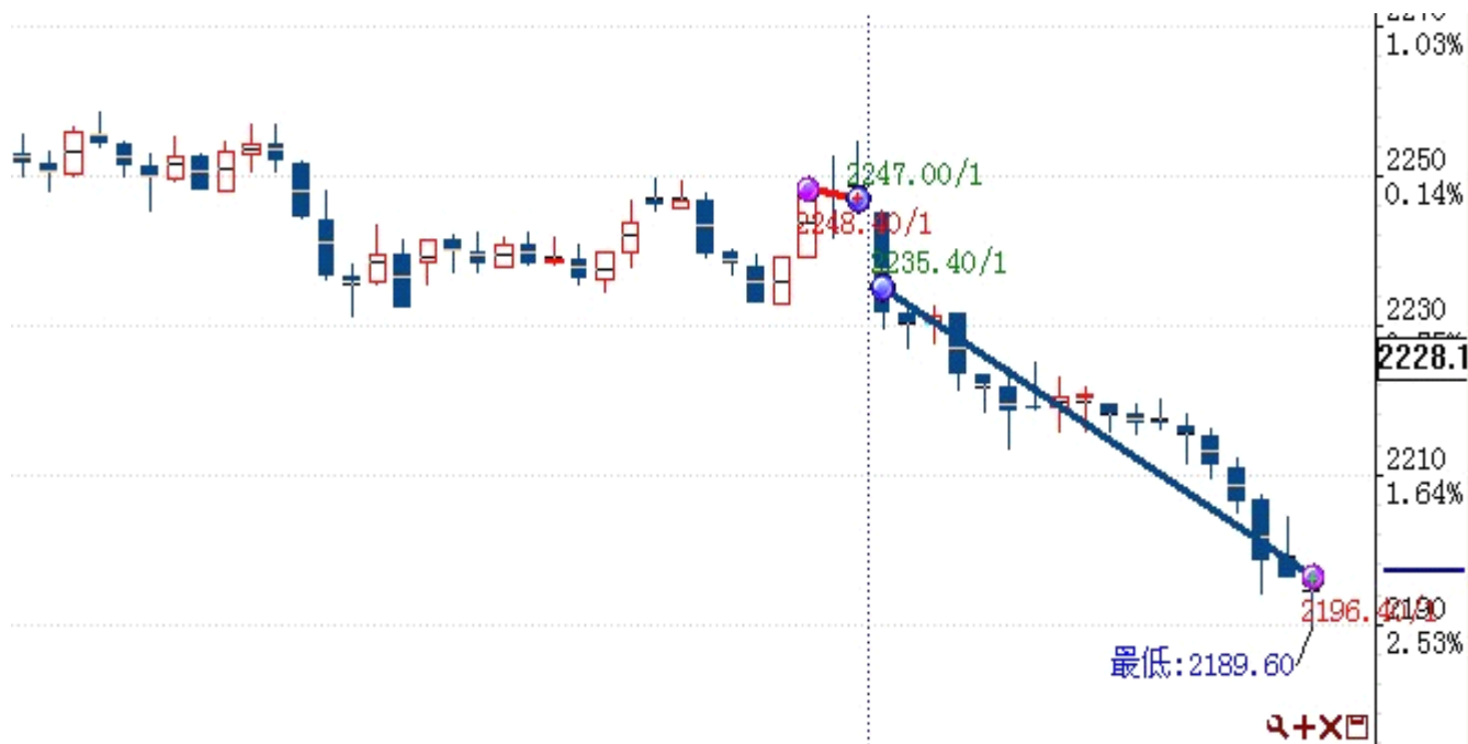
图表 2: 交易情况