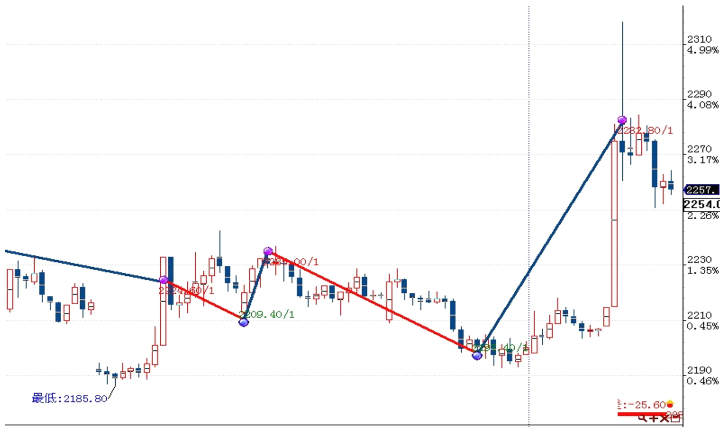
图表 1: 交易痕迹

初始资金 995868 元, 起始日期: 2012年5月8日 截止 2012年9月27日, 总权益: 925282元