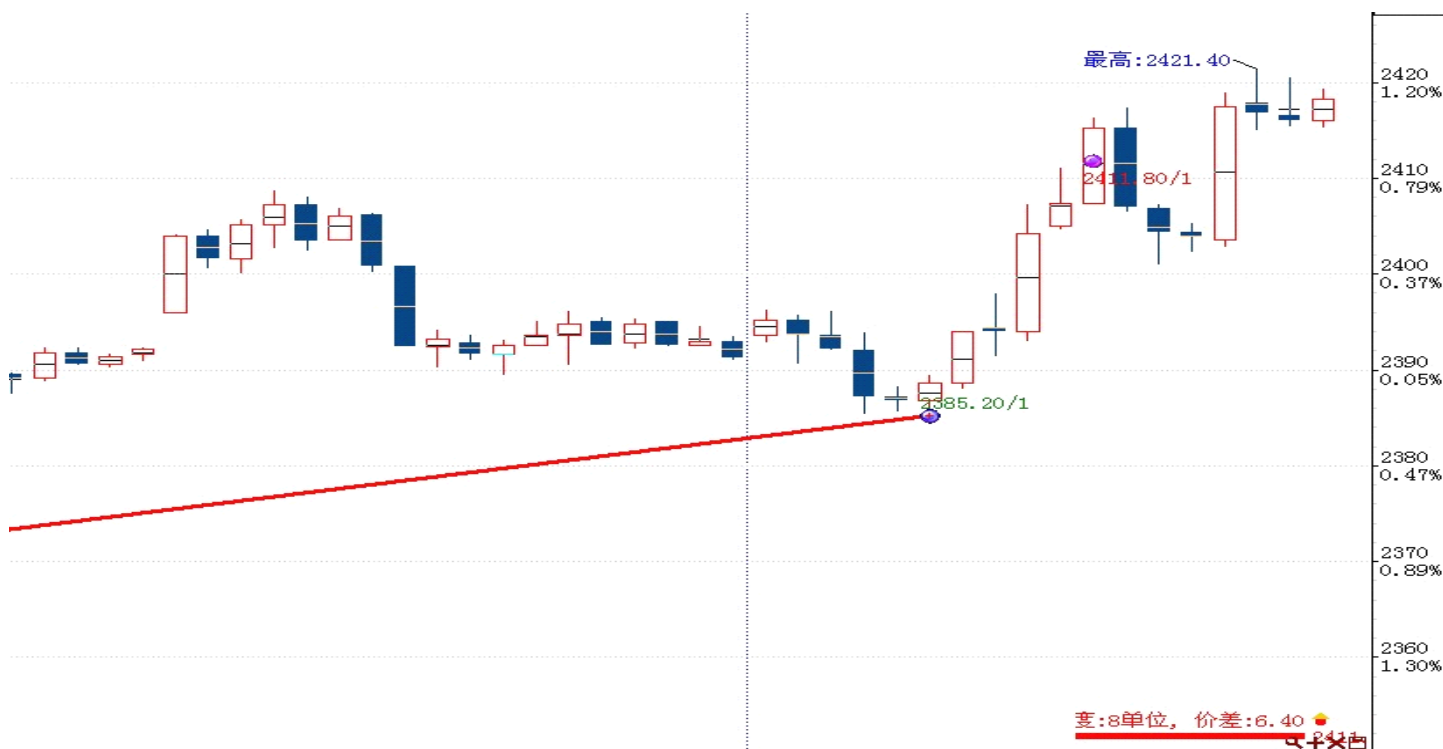
图表 2: 交易情况